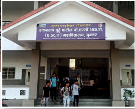
जुन्नर शाळेचा परिसर