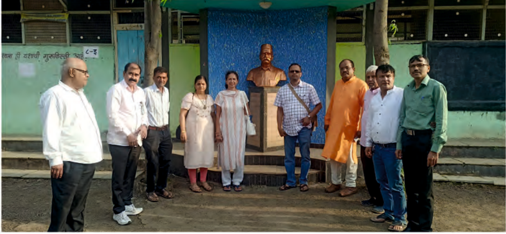
जुन्नर येथे शोकसभेप्रसंगी