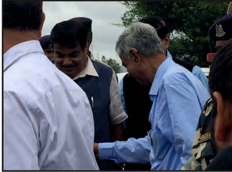
श्री. नितीन गडकरी यांची खडकवासला धरणाला भेट