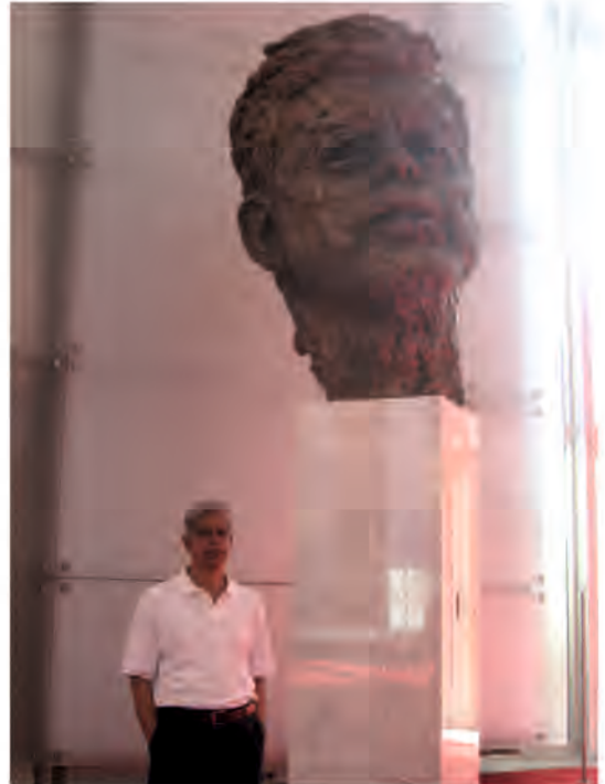
केनडी परफॉर्मन्स सेंटर, वॉशिंग्टन डी सी