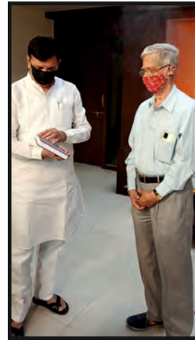
विविध संस्थांतर्फे झालेले सत्कार