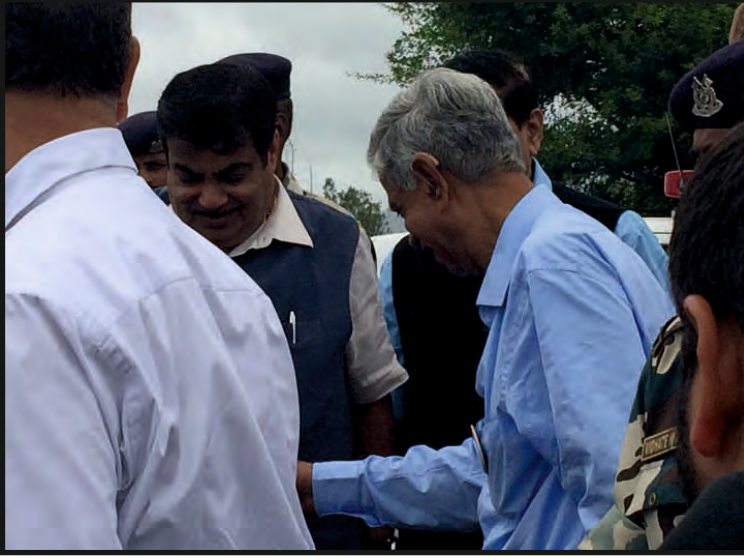
श्री. नितीन गडकरी यांची खडकवासला धरणाला भेट