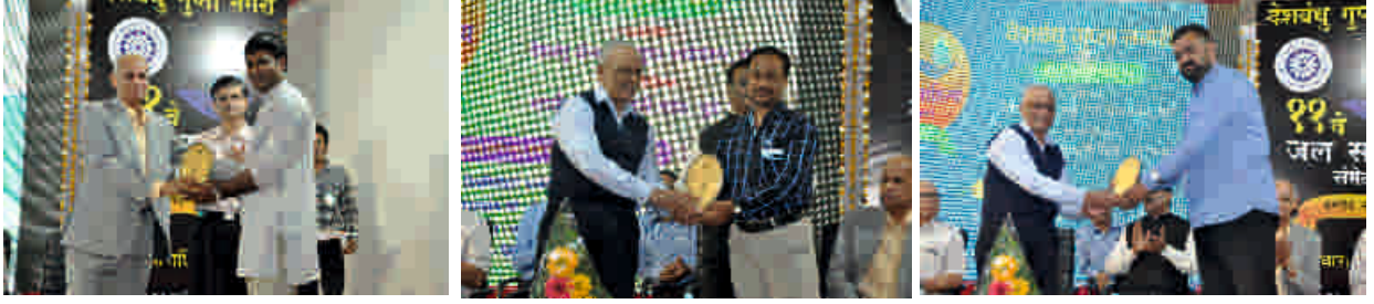
विविध मान्यवरांचे स्वागत