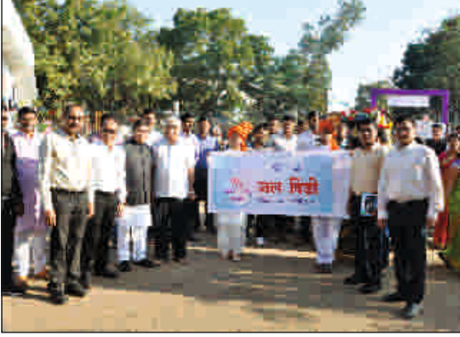
सम्मेलन स्थळी जलदिंडीचे स्वागत करतांना